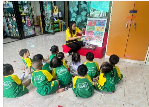
เด็กและครูร่วมกันทบทวนประสบการณ์เดิม