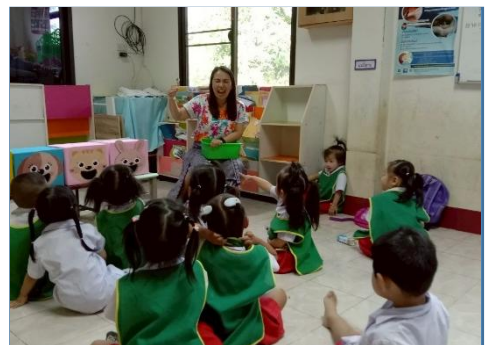
เด็กฝึกปฏิบัติเรียนรู้เรื่องตัวเลขและจำนวนจากการใช้สื่อชุด ฝึกนับจำนวนอาหารของสัตว์