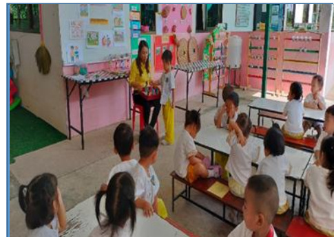
เด็กฝึกปฏิบัติเรียนรู้เรื่องตัวเลขและจำนวนจากการใช้สื่อชุด ฝึกนับจำนวนรูปสัตว์