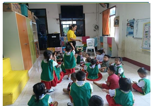
เด็กร่วมกันเล่น สื่อชุด ฝึกนับจำนวนอาหารสัตว์แบบกลุ่ม