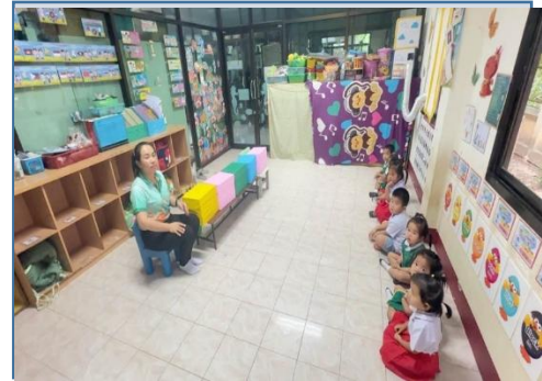
อธิบายและสาธิตวิธีการเล่น สื่อ ชุด ฝึกนับจำนวนอาหารสัตว์