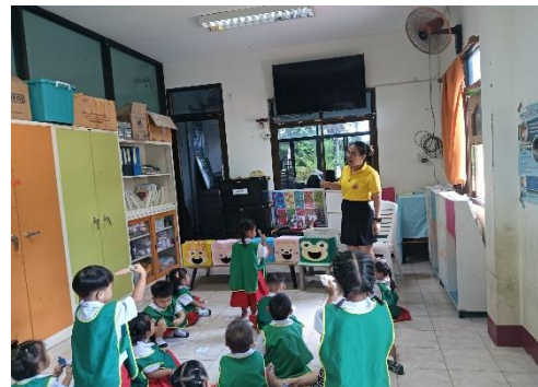
เด็กร่วมกันเล่น สื่อชุด ฝึกนับจำนวนอาหารสัตว์แบบคู่และแบบเดี่ยว