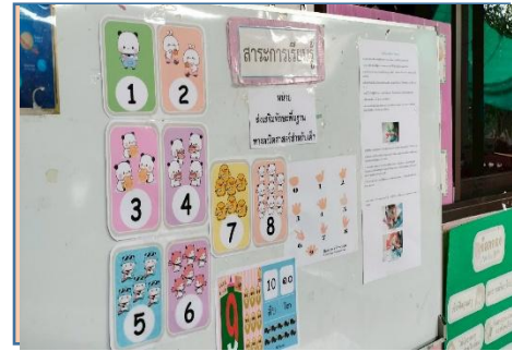
เด็ก ๆ ร่วมกันอ่านชาร์จเพลง “ตัวเลข”